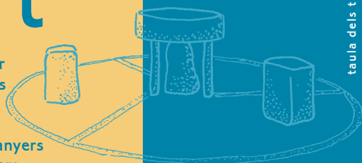
taula dels tres bisbes

Els Esqueis de Bovilar La font de les Nàiades La fàbrica de pipes La Tordera Les perxadades de castanys Els rastres dels senglars La roureda de fulla gran El granit i el sauló La font Bona Els ocells L'ermita El paisatge